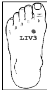
شکل ۱- نقطه liv3

طبق تئوری، علت دیسمنوره اولیه کمبود یا رکود انرژی در رحم می‌باشد و درمان درد خونریزی قاعدگی به تعدیل جریان انرژی، خون و تنظیم اعمال اندام‌های درونی بدن به‌ویژه کبد، طحال و کلیه نیاز دارد (۱۵). دیسمنوره براساس تئوری چینی به دو دسته تقسیم می‌شود (۱۶) (الگوریتم ۱). با توجه به معیارهای دیسمنوره اولیه در این پژوهش و تطابق آن با سندروم فزونی (Excess Syndrome) پژوهشگر نقطه فشاری liv3 را انتخاب نموده است. نقطه liv3 اعمال کبد را در جریان آزادسازی انرژی و خون تنظیم می‌کند. همچنین این نقطه به کبد در انبار کردن خون کمک نموده و برای درمان میگرن، اختلالات هضمی، تحریک‌پذیری، بی‌خوابی و مشکلات قاعدگی مورد استفاده قرار می‌گیرد