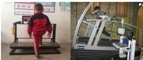
شکل ۱- آزمون استاندارد روی تردمیل به روش گاز آنالایزور و آزمون پلکان فرانسسیس با دستگاه ارگوستپ

و نواخت منظم و قابل تنظیم آهنگ گام‌برداری که قابلیت اجرای انواع آزمون‌های پلکان را دارا می‌باشد، اجرا شد (شکل ۱).