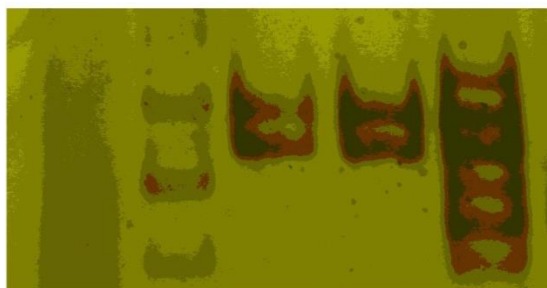
STD OPT STD OPT Ladder

شکل ۱- تکثیر DNA استخراج شده با دو روش فنل کلروفرم سیلیکا معمولی (A) و روش بهینه‌شده (B) در منطقه پلی‌مورفیک CD4